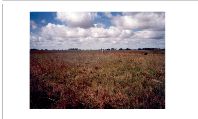
Fig. 3. Chilcal de Baccharis salicifolia .